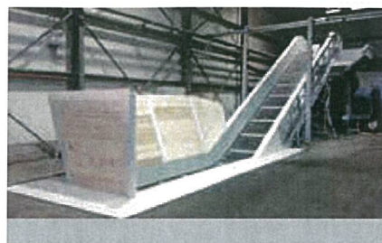
Řetězopásový dopravník s dřevěnými násypnými bočnicemi

Po uvedení do provozu je linka pod servisním dohledem společnosti. V případě potřeby změny koncepce je tato změna opět nejprve konzultována s odborníky a teprve potom prezentována zákazníkovi. Po odsouhlasení a objednání je provedeno doplnění linky.